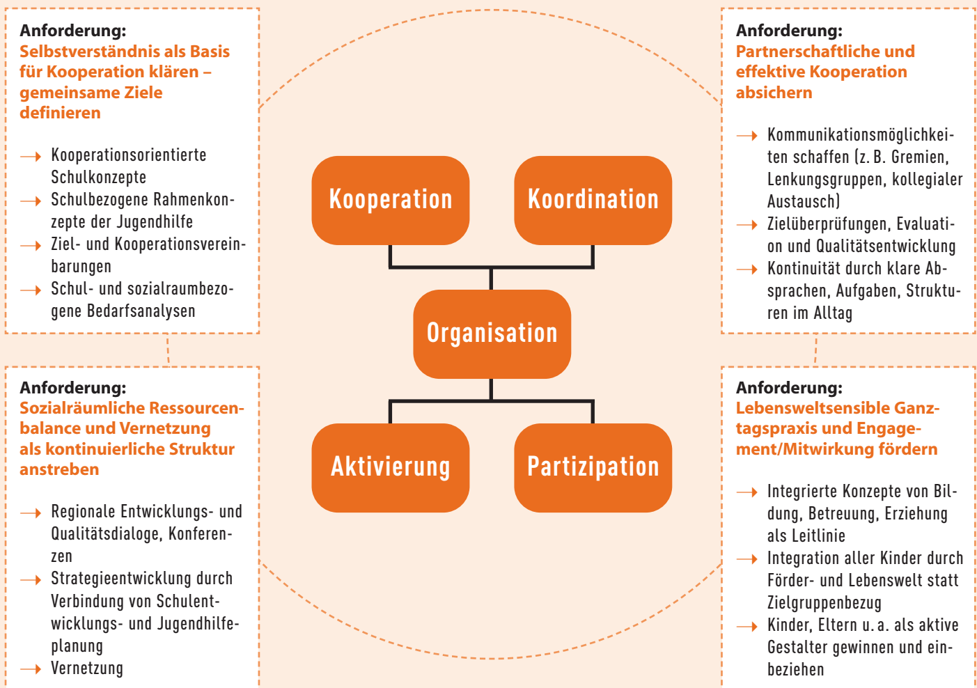
Abb. 6: Stützpfiler und Maximen der Kooperationsentwicklung: Anforderungen und Voraussetzungen zur Zielerreichung

Kooperation: Hier ist die Zusammenarbeit verschiedenster beteiligter Fachkräfte zentrales Ziel, die Entwicklung von Schule als multiprofessionellem Ort; dadurch können zwischen den Kooperationspartnern Perspektivenwechsel, Anregungen, gegenseitiges und voneinander Lern/Wissensaustausch, Entlastung, Nutzen für die Arbeit und natürlich das gemeinsame Gestalten vielfältiger Angebote des Schulalltages befördert werden.