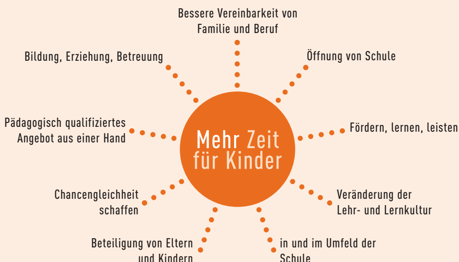
Abb. 2: Ziele der offenen Ganztagschule (Quelle: MSJK NRW (Hg.): GanzTag in NRW. Die offene Ganztagsgrundschule. Ein Leitfaden für Schule und Jugendhilfe. Düsseldorf 2004)

Zielsetzungen, die für die OGs formuliert werden, sind nicht nur auf den quantitativen Ausbau bezogen, ebenso geht es um eine qualitative Verbesserung von Schule und der Lebenssituation der Familien. Es soll ein umfassendes Bildungs- und Erziehungsangebot geschaffen