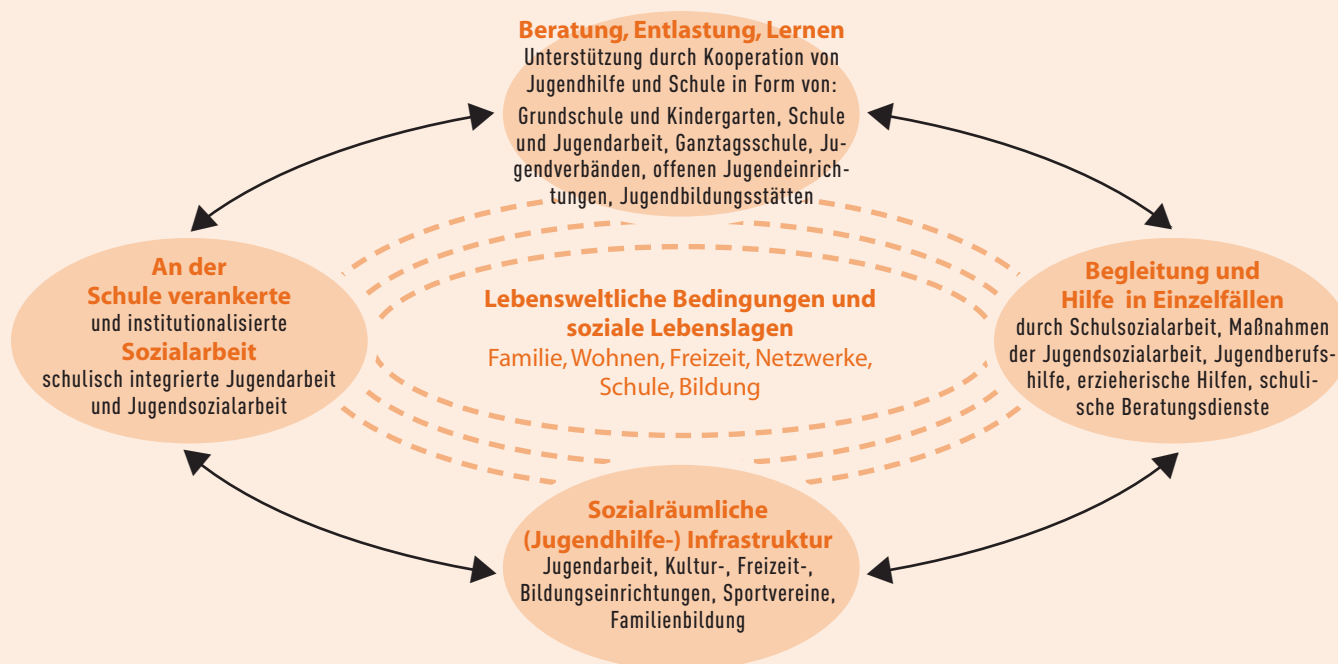
Abb. 3: Kooperation als Element der unterschiedlichen Bausteine von Jugendbildung und –förderung

ständnis von Bildung zu präzisieren, in den Handlungsfeldern zu verorten, dort zu beschreiben und in konkrete Praxisprogramme münden zu lassen. Ihr Anteil, der sozialpädagogische Beitrag zur Gestaltung von Bildungsprozessen muss dabei geschärft, von schulischer Bildung abgegrenzt und dadurch auch in ihrem gegenseitigen Ergänzungsverhältnis und möglichen Synergieeffekten verdeutlicht werden: Jugendhilfe ist soziale Bildung (siehe Abschnitt 2). Jugendhilfe muss sich in diesem Zusammenhang jedoch verstärkt auf ihren genuinen sozialpädagogischen Auftrag und ihre Maximen rekurrieren , Bildungsförderung in den Kontext der Minderung von sozialer Benachteiligung, der sozialen Integration als auch der Mitgestaltung und des Erhaltes von positiven Lebensbedingungen junger Menschen und Familien stellen. Sie darf sich im Zuge der neueren Bildungsdebatten und Kooperationsdiskussionen nicht auf eine reine institutionen- (schul-, wenn auch ganztagschul-) bezogene Perspektive in ihren Aufgaben reduzieren lassen, sondern dies als einen weiteren und wichtigen Baustein innerhalb einer Gesamtverantwortung für die Gestaltung einer kommunalen Angebotslandschaft der Jugendförderung und –bildung verstehen. Diese schließt unterschiedliche Kooperationsfelder ein, kann mithin nur „als Ganzes“, in Wechselwirkung des Gesamtjugendhilfesystems, ihre nachhaltige Wirkung erzielen (vgl. grundlegende Gedanken dazu bei Schrappner 2002, übertragen auf die Kooperation von Jugendhilfe und Schule bei Maykus 2004):